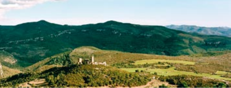
El castell de Saburella