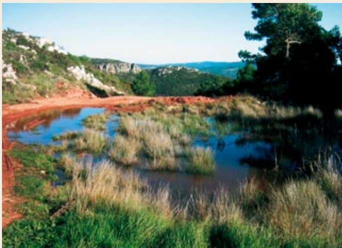
Toll d'aigua al darrere del castell de Selmella

on es disputen la propietat del castell la família Cervelló i els senyors de Santa Perpètua.