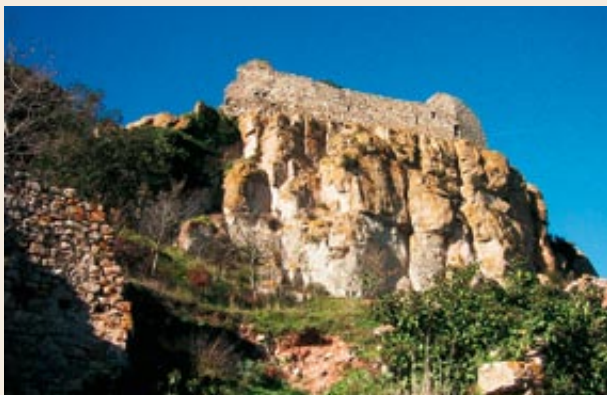
Restes del castell de Selmella

A mitjan segle XIX, Selmella constava com una part del municipi del Pont d'Armentera, tot i mantenir una identitat pròpia. Com a població del seu terme s'esmenten només tretze masos habitats, amb un total de 69 habitants. El primer decenni del segle XX totes les cases encara estaven dempeus, però el 1952 només en quedava una d'habitada. La seva situació, els pocs camps de conreu situats per aquests verals, la manca de bones comunicacions i l'isolament general de la zona van fer que els seus pobladors busquessin millors condicions de vida.