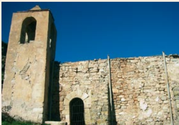
Església de Sant Llorenç