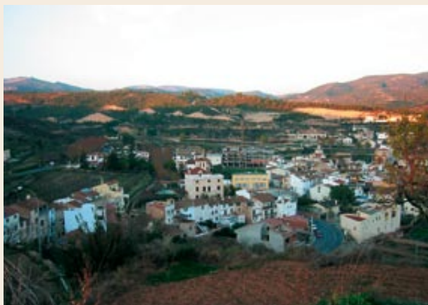
El Pont d'Armentera

Bifurcació de pistes (600 m). Seguim la pista que puja. La de la dreta ens permetria arribar al riu Gaià i al Pont seguint els torrents de Batllet, de Rosic i el Pendot.