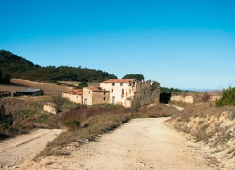
Masia de cal Boada