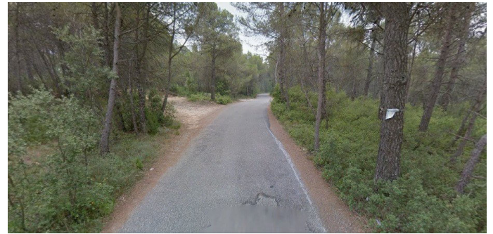
Una imatge de l'entrada a la urbanització de Mas Vermell.

Els Ajuntaments de Querol i Pontons han acordat arranjar l'entrada a Mas Vermell assumint al 50% els 3.100 euros de pressupost . Es posarà formigó a laterals del camí i es tallaran els pins més molestos. L'Ajuntament de Querol ha arranjat també la pista de Ranxos de Bonany per habilitar-hi un accés .